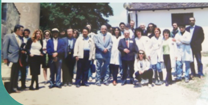
Figura 3 - 23 maggio 1998, ConSDABI Azienda Casaldianni Visita degli Addetti Agricoli delle Ambasciate straniere accreditate presso il Governo Italiano.

A partire dal suddetto anno – con cadenza biennale o triennale – il ConSDABI è oggetto di visita degli addetti agricoli delle Ambasciate straniere accreditate presso il Governo italiano (Figura 3) e di riunioni del Comitato tecnico scientifico (con cadenza annuale) Figura 4).