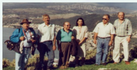
Figura 14 -Grecia, settembre 1998 Visita nell'ambito della collaborazione 'Consdabi - Ministero dell'Agricoltura Repubblica Ellenica - Facoltà di Agraria dell'Università di Thessaloniki' .

Si ricorda che la prima collaborazione sulla tutela della biodiversità risale agli anni '70 con la partecipazione dell' Università di Napoli "Federico II", nella persona del prof. D. Matassino, al Progetto Finalizzato (PF) del CNR, dal titolo "Difesa delle Risorse Genetiche delle Popolazioni Animali" (1970-1975), proposto e diretto dal prof. G. Rognoni; progetto che sfocia nella istituzione dell' IDVGA (Istituto per la Difesa e la Valoriz-