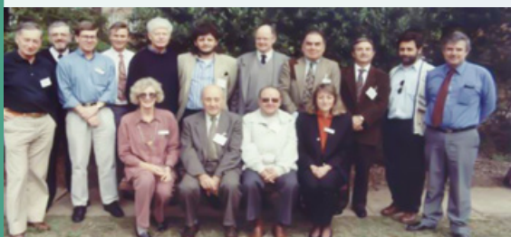
Figura 11 - Sidney (Australia), 1995. CNR - CSIRO co-operation.

laborazione con la Facoltà di Agraria della Thessaloniki University, (Figura 14) , Turchia [Seminario su "Proteomic and Genomic techniques in the process of conservation of native animal genetics resources" , Trakya University, Agricultural Faculty of Tekirdag, Department of Animal Science Biometry and Genetics Field, 15-16 giugno 2005]].