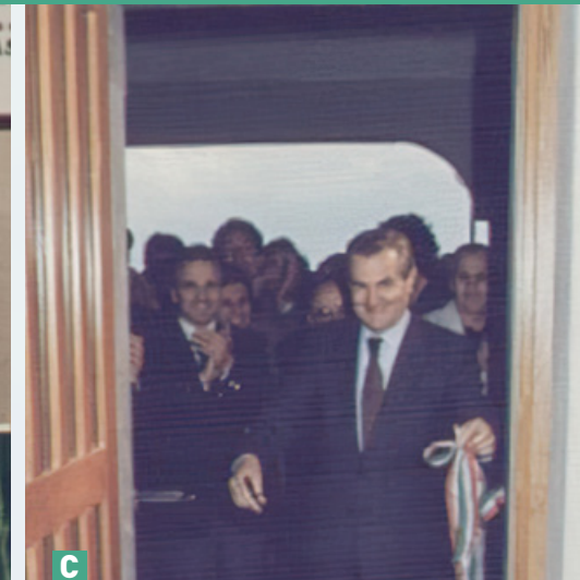
17 - 19 aprile 1990, Azienda 'Casaldianni' - Inaugurazione 'ConSDABI' Convegno "Un'arca per il 2000"