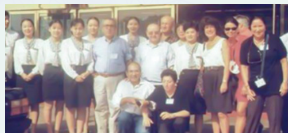
Figura 12 - Pechino (Cina), 1997 Incontro nell'ambito della Sino-Italian (CNR) co-operation.