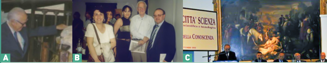
Figura 19 - 9 settembre 2000 -Visita da parte del prof. Cavalli Sforza presso il ConSDABI, Azienda Casaldianni Circello (foto a) in occasione del Convegno “Le frontiere della conoscenza” (foto b, c).