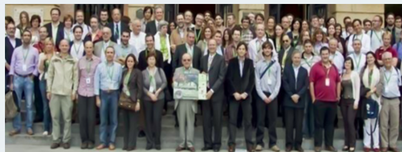
Figura 17 Cordoba, 14-16 ottobre 2010 - 7 th International Symposium on the Mediterranean Pig.