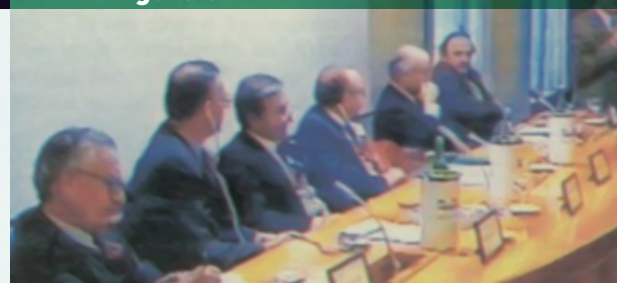
Figura 5 - Benevento, 26-29 novembre 1995 International Symposium on “Mediterranean Animal Germplasm and Future Human Challenges”.