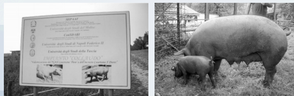
Figura 15 - Struttura "collaudo" per l'allevamento del suino 'Casertana' presso un imprenditore agricolo operante nel bioterritorio sannita.

Dei finanziamenti ottenuti, il ConSDABI ha investito in attrezzature moderne, in impianti collaudo ecc., realizzando, tra l'altro, in Circello (BN), un polo di tutela 'in vivo' unico, fra 44 NFP europei, per la presenza, nel corso degli anni, di 61 TG/TGA/TGAA delle più importanti specie di interesse zootecnico nonché, nell'ambito del progetto "Valorizzazione del TGAA 'Casertana' 'puro' e incrociante il TG Duroc" finanziato dal già Mipaaf, una struttura "collaudo" per l'allevamento del suino 'Casertana' presso un imprenditore agricolo operante nel bioterritorio sannita ( Figura 15 ).