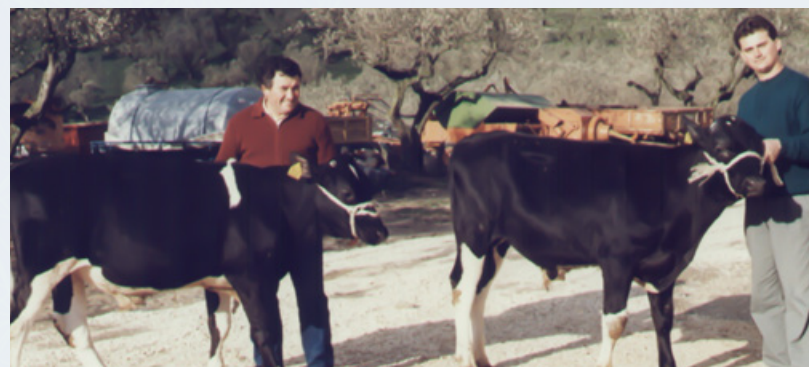
Figura 16 Bovino Frisone italiana: fratelli monozigoti ottenuti da clonazione mediante splitting.