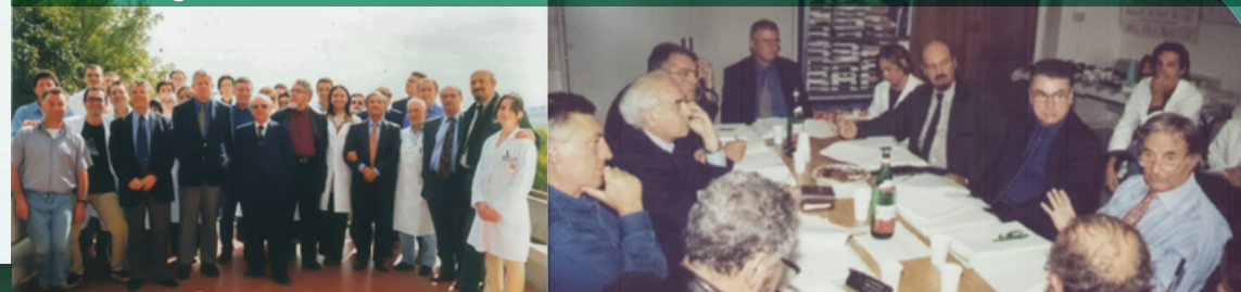
Figura 4 - 24 settembre 2001, ConSDABI Azienda Casaldianni Riunione del Comitato Tecnico Scientifico.

Nel 1995, presso il ConSDABI, in collaborazione con l'EAAP e con il patrocinio della Regione Campania, della Provincia di Benevento (Socio del ConSDABI dal 2003 al 2013) e della Camera di Commercio per l'Industria, l'Artigianato e l'Agricoltura di Benevento (Socio del ConSDABI dalla fondazione al 2016), vengono organizzati due Simposi internazionali (Figura 5 e 6):