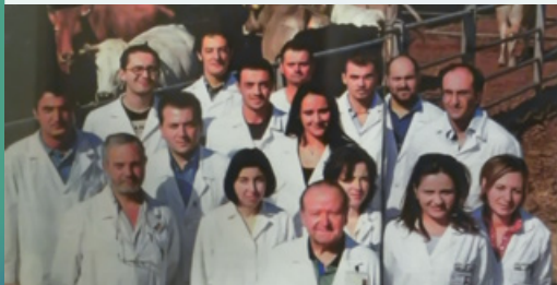
Figura 20 - Visita presso l'Azienda Casaldianni (Circello, BN) da parte dell'equipe del settimanale 'Famiglia Cristiana'.

Tra i progetti finanziati al ConSDABI, si ricordano i seguenti: